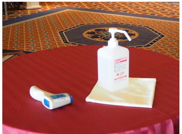
会場各所に消毒液の設置