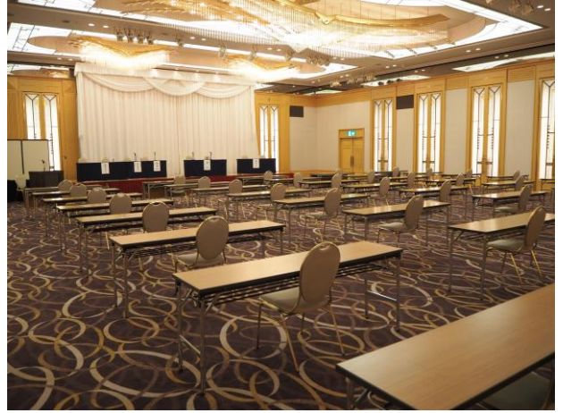
会場座席間隔の確保