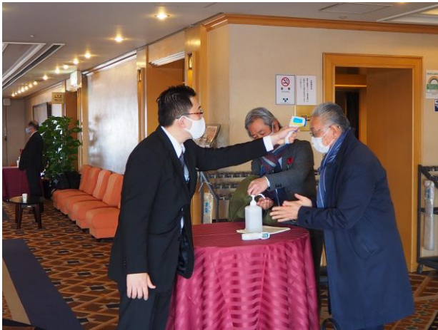
スタッフ・ご来場者様の検温